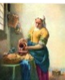
La Laitière Johannes Vermeer- 1632-1675 1658

*La révocation de l'Edit de Nantes, promulgation de l'Edit de Fontainebleau 1685