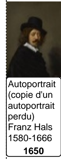
Autoportrait (copie d'un autoportrait perdu) Franz Hals 1580-1666 1650