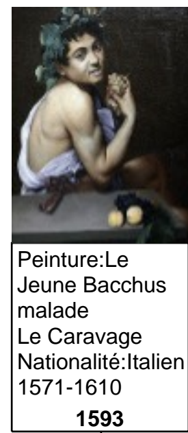
Peinture: Le Jeune Bacchus malade Le Caravage Nationalité: Italien 1571-1610 1593

*Promulgation de l'Edit de Nantes. Devenu roi de France en 1589, après s'être converti au catholicisme, Henri IV impose la fin des guerres de religion, en promulguant le 13 avril 1598 l'édit de Nantes. Celui-ci institue l'égalité civile entre protestants et catholiques. L'édit de Nantes permet à la communauté protestante d'exister, mais dans le carcan juridique d'une réglementation qui, en fait, limite la pratique du culte réformé. C'est l'acte majeur d'Henri IV qui apporte la paix en France, après une période de trente-six ans de guerres de religion.