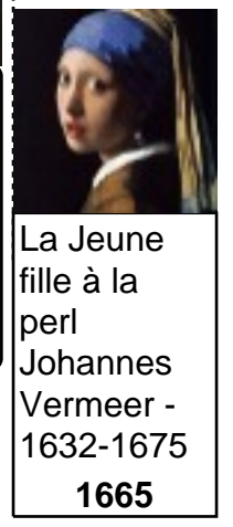
La Jeune fille à la perl Johannes Vermeer - 1632-1675 1665

*Louis XIV, l'ascension du Roi Soleil La devise de ce monarque était "Au-dessus du reste des hommes". En effet, c'est lui qui s'est octroyé le Soleil comme symbole. C'est un emblème très fort, car il donne la vie à toute chose présente sur Terre. C'est pour cela qu'il le choisit. En 1662, lors du Ballet de la nuit, il apparaît habillé en soleil. Il régna de 1643 à 1715. Il montera sur le trône âgé de seulement quatre ans et demi. C'est d'ailleurs le plus long règne français, 72 ans.