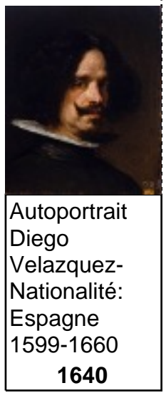
Autoportrait Diego Velazquez- Nationalité: Espagne 1599-1660 1640

*Guillaume III d'Orange de Nassau 1650 à 1702