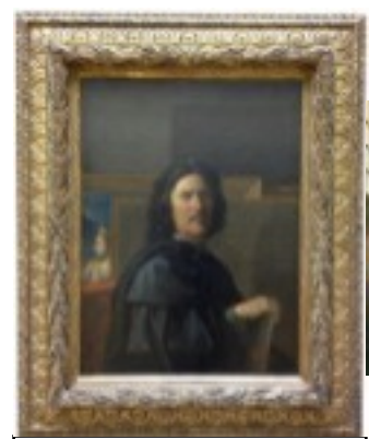
Autoportrait Nicolas Poussin - Nationalité: Française 1594-1665 1650