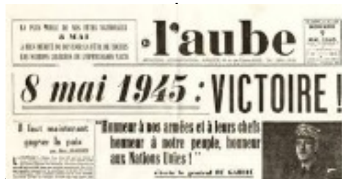
capitulation de l'armée Allemande