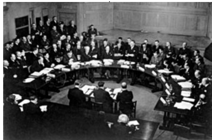
Première assemblée générale de l'ONU à Londres