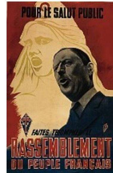
Création du Rassemblement du Peuple Français (RPF) par le Général de Gaulle