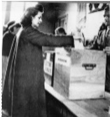
droit de vote des femmes