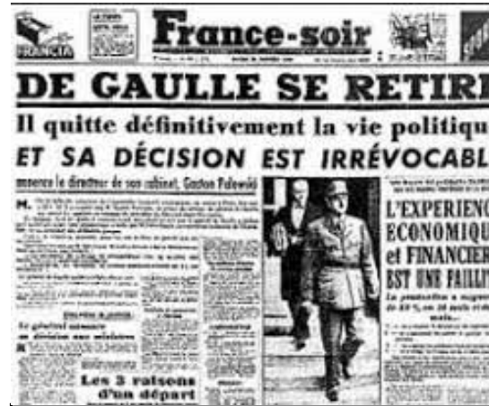
De Gaule se retire de la vie politique