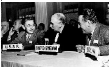
Les accords de Bretton Wood