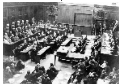
Les procès de Nuremberg