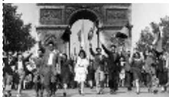
libération de la France