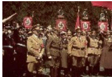
chute du Reich Allemand