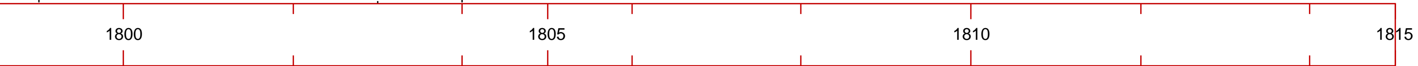
...es préfets et création de la banque de France 1800