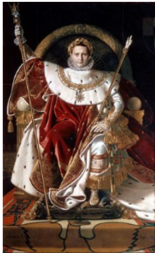
napoléon Bonaparte devient empereur de France 1804