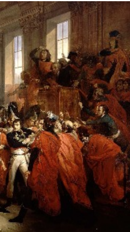
...te prend le pouvoir par un 1799