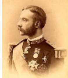
Publicación do Manifesto de Sandhurst (01/12/1874)