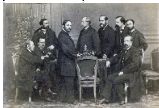
Formación do Goberno Provisional (06/10/1868)