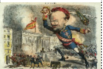
Golpe de Estado do xeneral Pavía (03/01/1874)