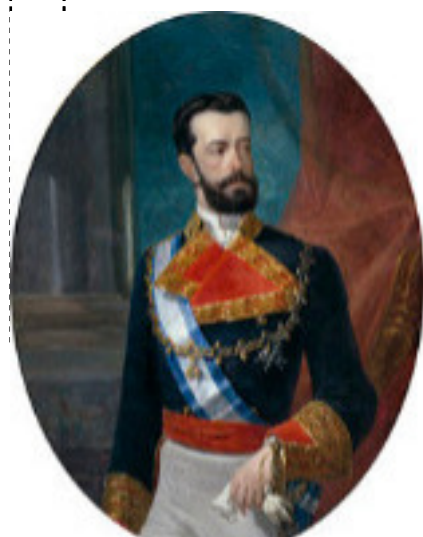
Elección de Amadeo de Savoia como rei (16/11/1870)