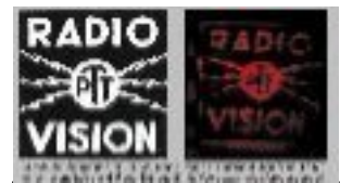
Télévision nationale (P.T.T) 1935