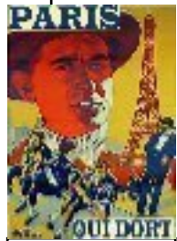
1er film (film muet) 1923