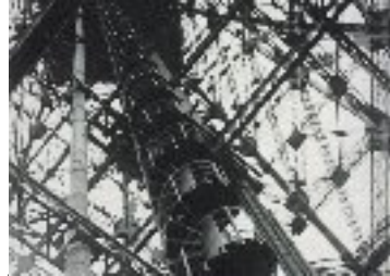
vente aux enchères internationales des escaliers de la Tour 1983