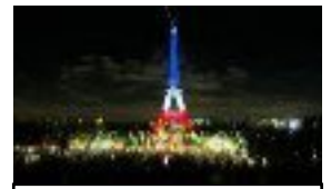
suite aux attentats 2015