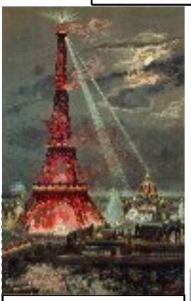
inauguration de la Tour 1889