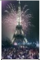
nouvel an 2000