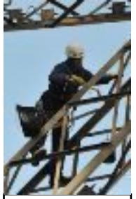
la Tour se fait belle comme tous les 7 ans 1995