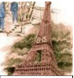
Horloge géante 1907