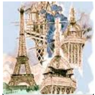
Suite à un incendie pose d'une nouvelle antenne = 320.75 mètres de haut 1957