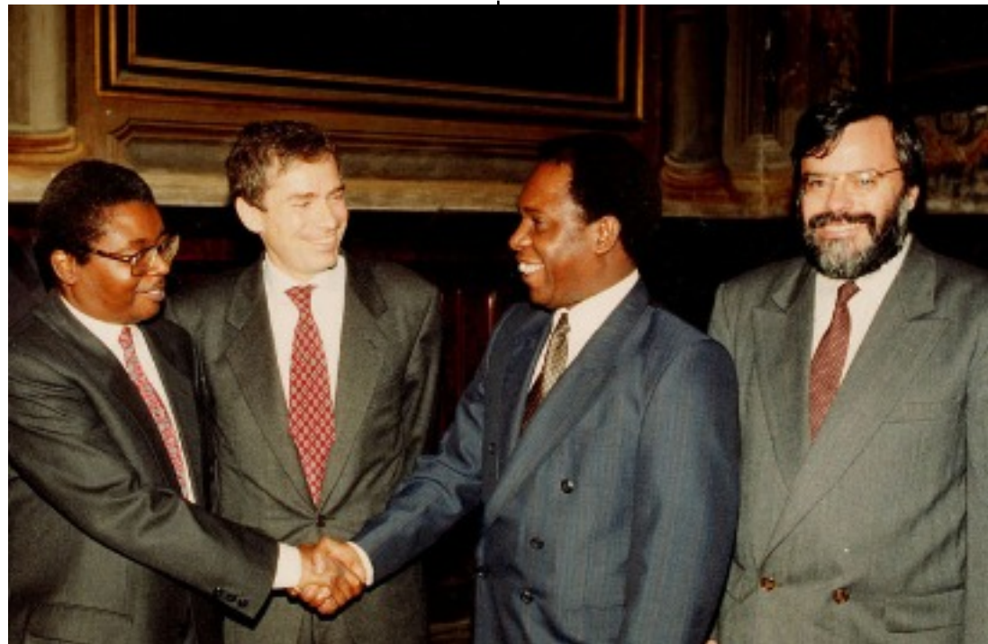
Signature à Rome, au siège de Sant'Egidio, de l'accord de paix mettant fin à la guerre civile au MOZAMBIQUE 04/10/1992