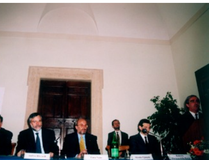
Signature de Pacte pour l'avenir de l'ALBANIE à Rome 23/06/1997