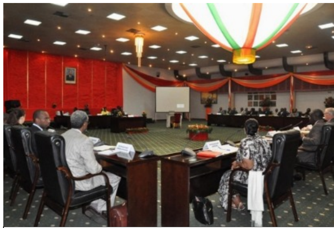
signature accord de paix pour la COTE D'IVOIRE à Ouagadougou 04/03/2007