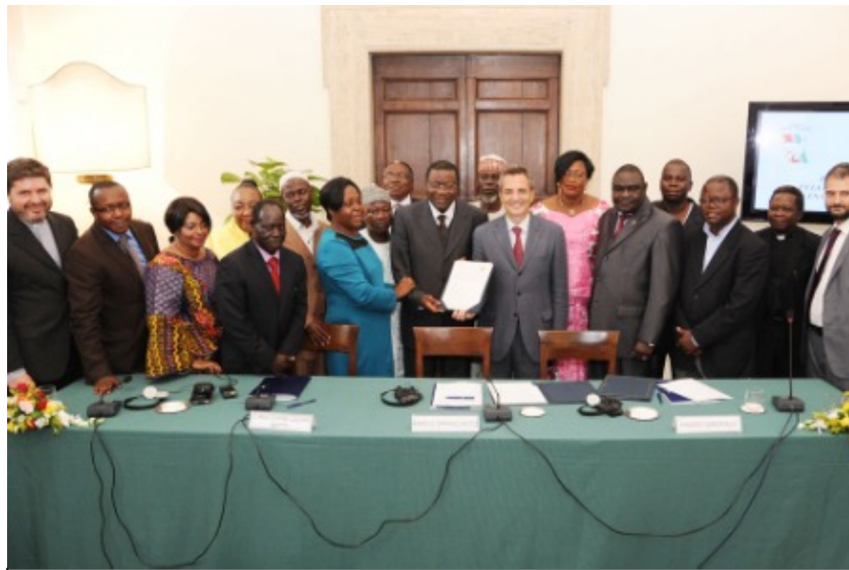
Signature à Sant'Egidio de l'appel de Rome pour la Centrafrique 09/09/2013