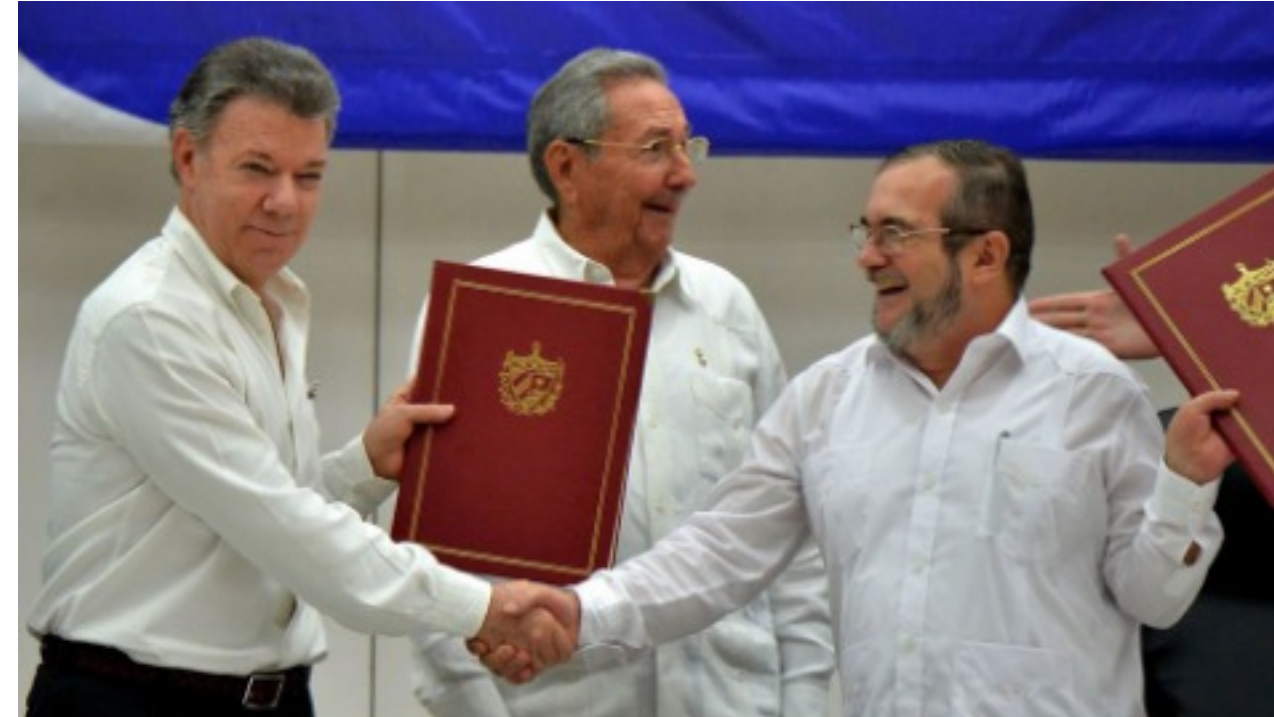
Signature accord de paix pour la COLOMBIE 01/11/2016