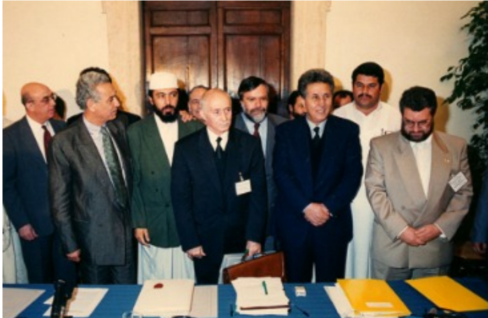
Signature de la Plateforme de Rome pour la solution politique et pacifique de la crise algérienne 13/01/1995