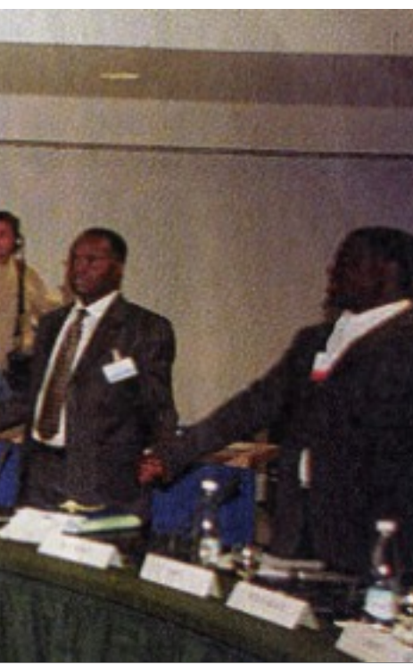
guerre civile faisant rage en