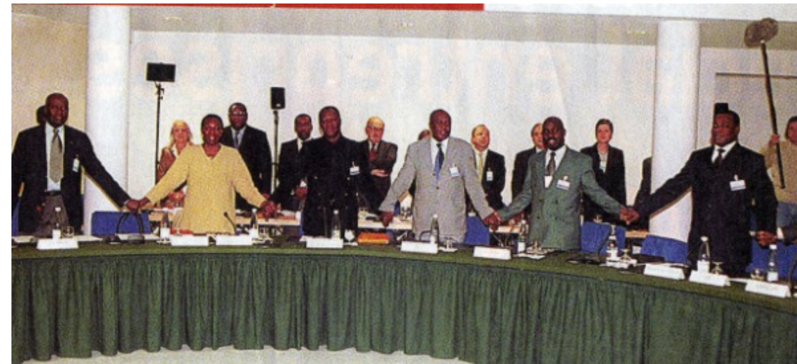
Participation de Sant'Egidio aux discussions en France à Linas-Marcoussis qui visaient à mettre un terme à la guerre en COTE D'IVOIRE depuis 2002