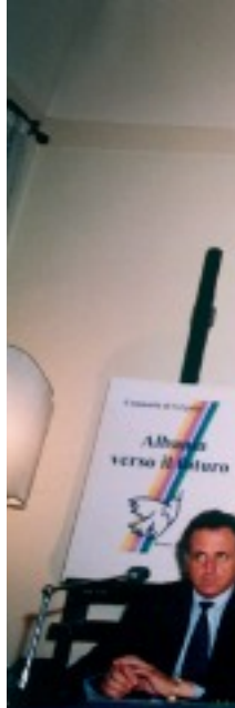
Signature de l'a...