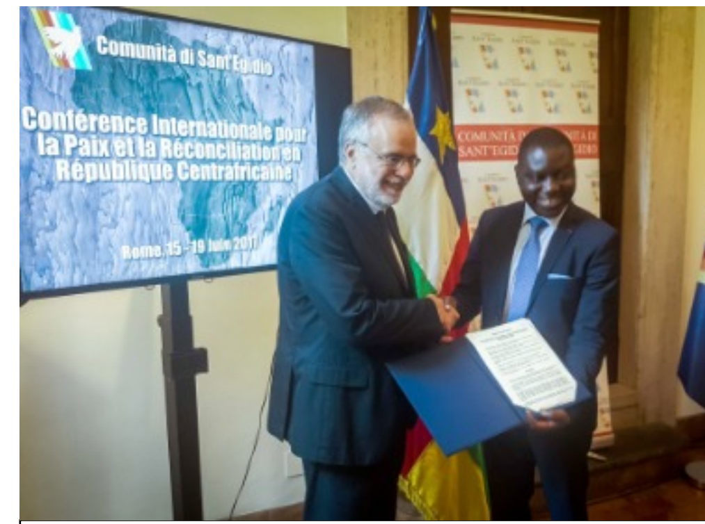
Signature de l'accord politique dit "Entente de Sant'Egidio" pour le cessez-le feu et une feuille de route pour la paix en REPUBLIQUE CENTRAFRICAINE à Rome 19/06/2017