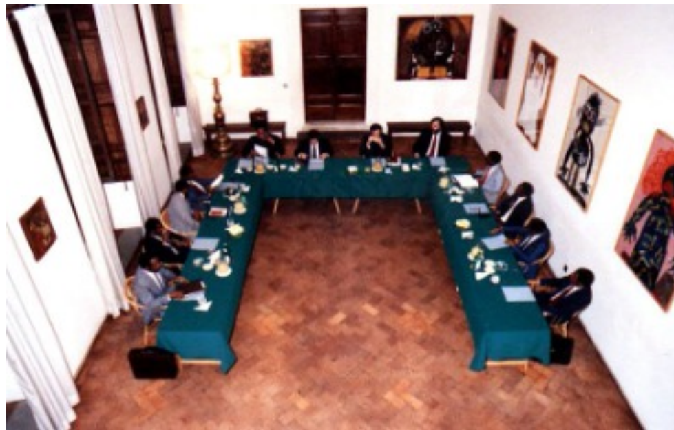
Négociations de paix au siège de Sant'Egidio à Rome, pendant 27 mois pour mettre fin à la guerre civile au Mozambique 01/01/1991