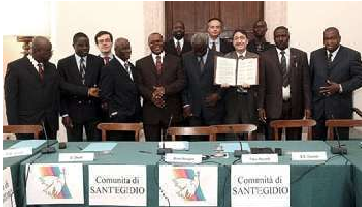
Signature accord de paix pour la CASAMANCE à Rome 22/02/2014