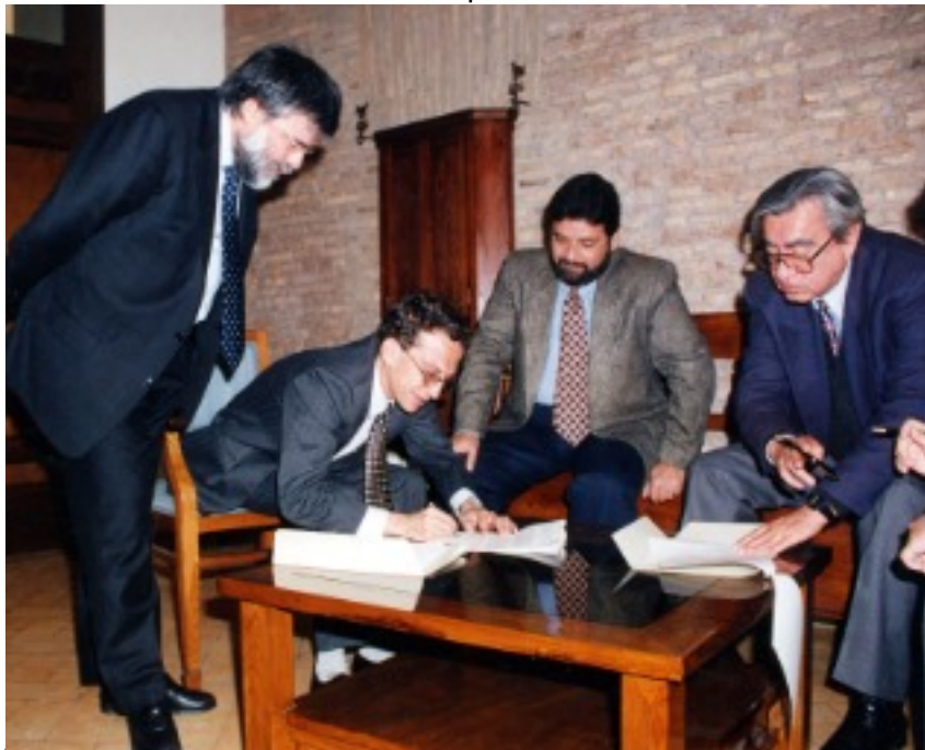
Signature d'Accord sur l'identité et les droits des populations indigènes au GUATEMALA 31/03/1995