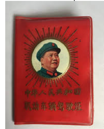
Publication du "Petit Livre Rouge" 1964