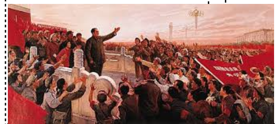
Révolution Culturelle 1966