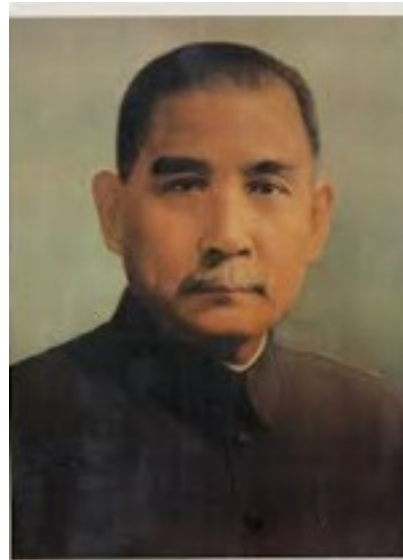
Sun Yat Sen fonde le parti nationaliste (Guomindang) 1912