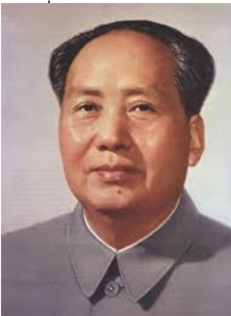
Victoire des communistes et proclamation de la RPC par Mao Zedong 1949