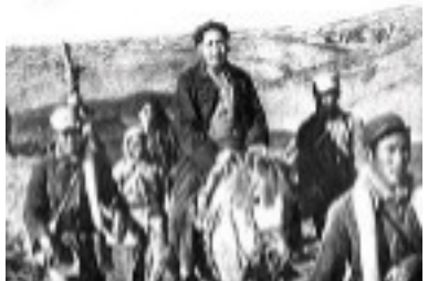
Début de la Longue Marche (1934-1935) 1934