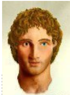
Alexandre le Grand (-356, -323) -338