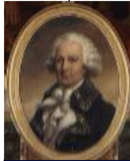
Louis-Antoine de Bougainville (1729, 1811) 1768