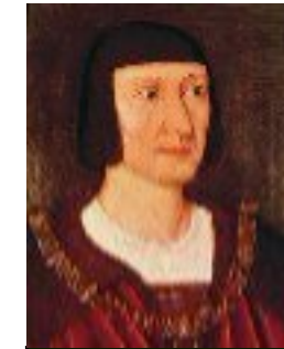
Bayard, le chevalier sans peur et sans reproche (1475, 1524) 1486