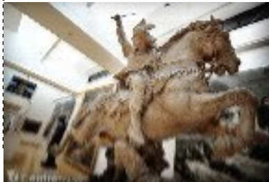
Camille Furianus et les Gaulois (fin -Ve siècle, -363) -403