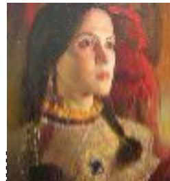
Anne Comnène (1083, 1153) 1091