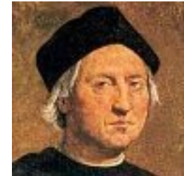
Christophe Colomb (1451, 1506) 1492