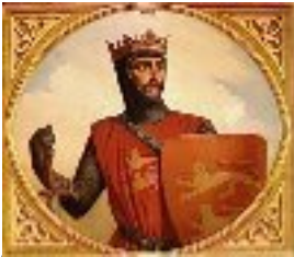
Guillaume le Conquérant (1027, 1087) 1033