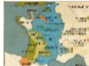
Crécy, Azincourt et Calais 1340