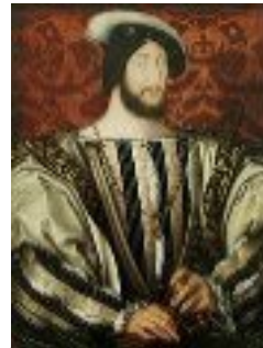
François Ier, un grand roi de France (1494, 1547) 1515