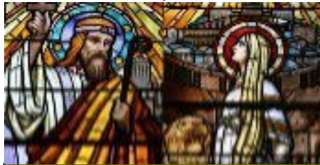
Ste Blandine et St Pothin 177