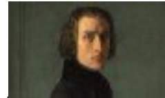
Franz Liszt, compositeur au grand cœur (1811, 1886) 1820