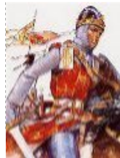
Baudouin IV, le roi lépreux (1161, 1185) 1174