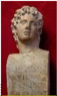
Alcibiade, un homme ambitieux et sans scrupule (-450, -404) -421