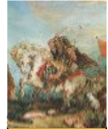
Attila "le fléau de Dieu" (395, 453) 434