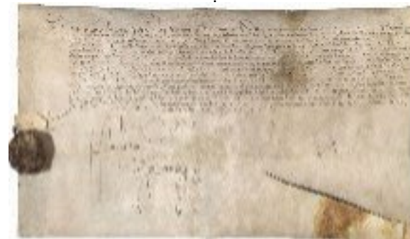
Edit de Nantes 1598