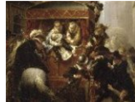
Assassinat de Henri IV 1610