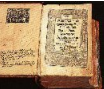
Bible, traduction en allemand. (Luther) 1534