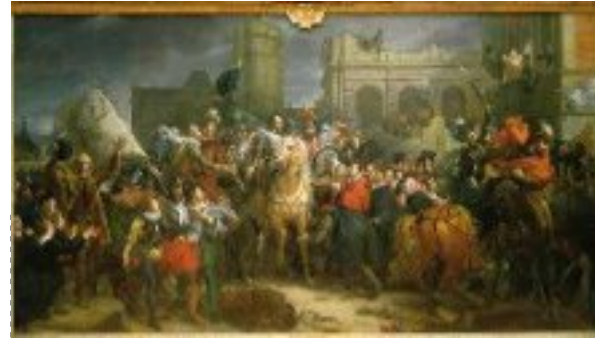
Henri IV à Paris 1593