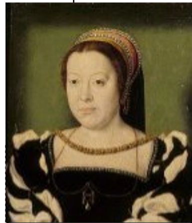
Régence de Catherine de Médicis 1560