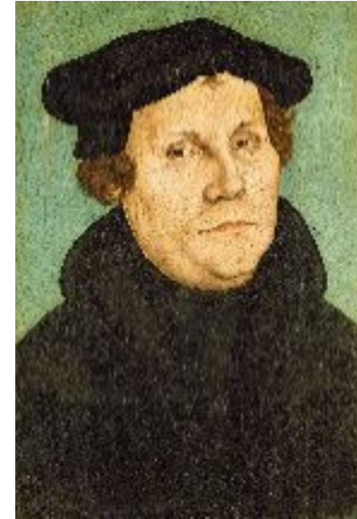
Martin Luther (1483-1546)