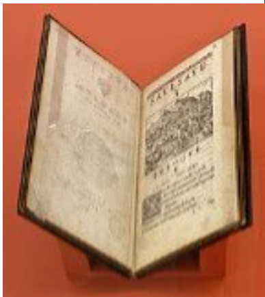
Eglogues (M. Scève) 1547