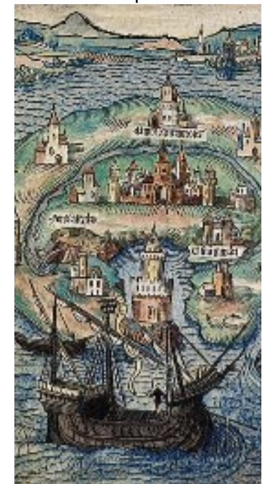
Utopie (Thomas More) 1616