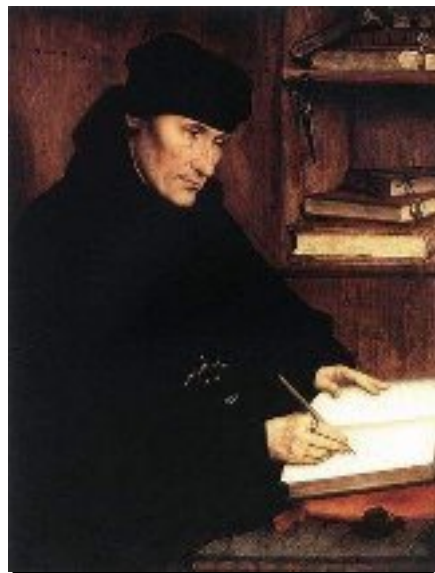
Desiderius Erasmus Roterodamus (Erasme) (1469-1536)