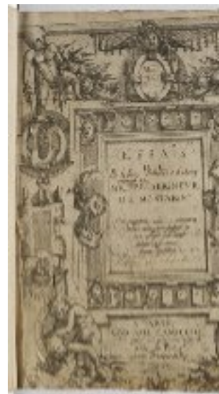
Les Essais (Montaigne) 1580