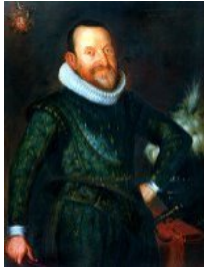
Théodore Agrippa D'Aubigné (1552-1630)