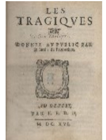
Les Tragiques (d'Aubigné) 1616