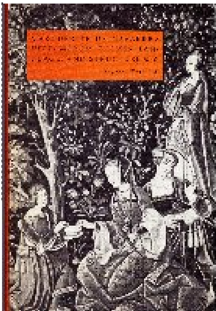
Heptaméron (Marguerite d'Angoulême) 1559