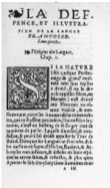
Défense et illustration de la langue française (Du Bellay) 1549