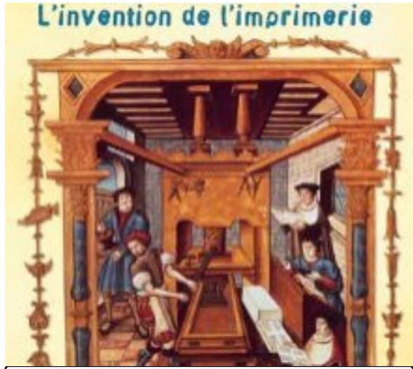
Gutenberg invente l'imprimerie 1454