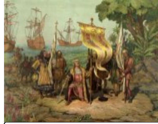
Découverte de l'Amérique par Christophe Colomb 1492