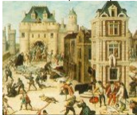
Massacre de la Saint Barthélemy 1572