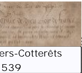
Les Misérables 1839