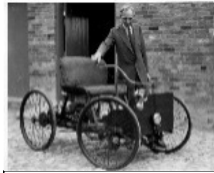
Le quadricycle d'Henry Ford 1896