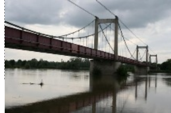
Pont suspendu de Bonny-sur-Loire Construit en 1899-1902 Pont en Acier Département Loiret