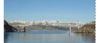
Pont de Sundoy (Poutre) Début des travaux et Achèvement 2003 Pont en Béton 120m.298m.120m (travée)