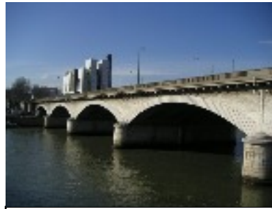
Pont en ARC de Paris Construit entre 1852 et 1853 ( en taille de pierre maçonnerie