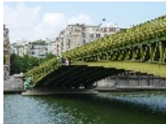
Pont Mirabeau à Paris (Poutre) Construit en 1896 et Achèvement 1896 en Acier