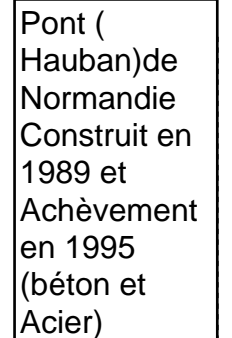
Pont (Hauban)de Normandie Construit en 1989 et Achèvement en 1995 (béton et Acier)