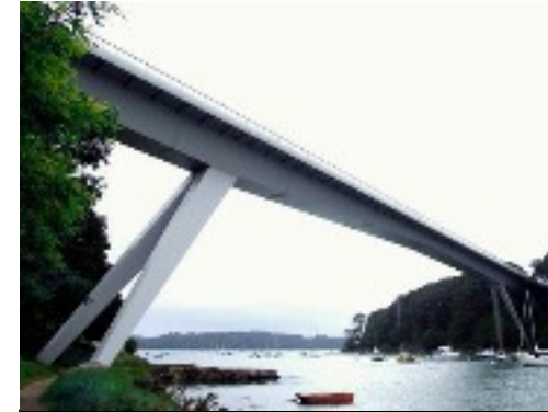
Pont Joseph le Brix (Béquille) Achèvement 1969 Pont en Acier Longueur Totale 300m