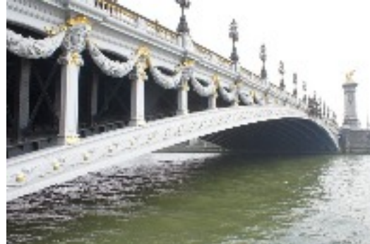
Pont en ARC Alexandre III Début des travaux 1896 et Achèvement 1900