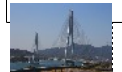
Pont de Tatarau (Hauban)Au Japon Construit en 1993 et Achèvement en 1999