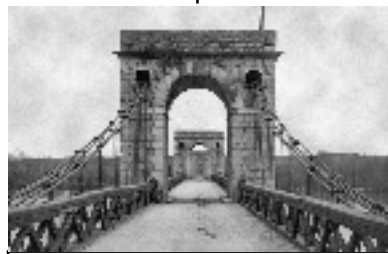
Pont suspendu St Thibault Construction en 1834 (béton armé)