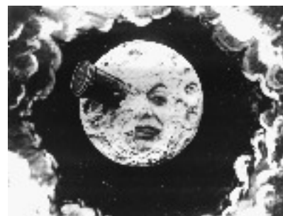
Le Voyage dans la Lune, Georges Méliès