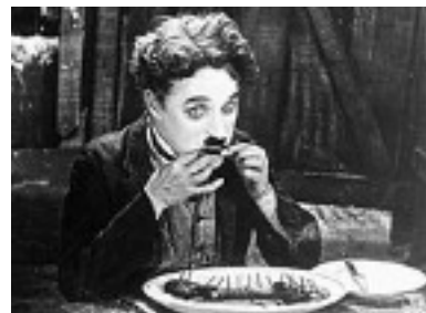
Premier long métrage de Charlie Chaplin : Le Kid