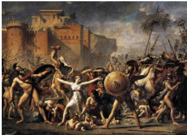
Le mythe des sabinnes. Tite-Live date la fondation de Rome par Romulus à 753 av J.C. Les débuts de la Rome antique sont teintés de légende.

Les patriciens renversent le dernier Roi romain : Tarquin le Superbe. 509 av J.C.