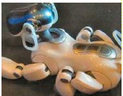
aibo, 1er robot domestique 1999