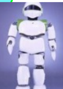
Hiro, 1er robot intelligent 2011