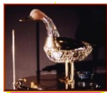
canard de vaucanson 1738