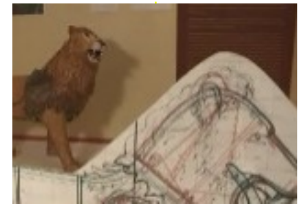
lion de léonard de vinci 1515