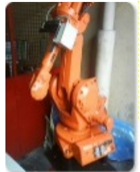
Premier robot industriel 1961