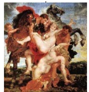
Paul Rubens peint L'Enlèvement des filles de Leucippe. (Baroque) 1618