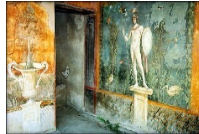
destruction de Pompéi. Fresque de la chapelle st Anne 79