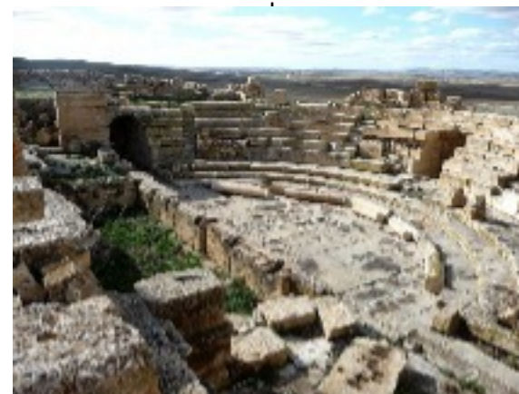
Ruines Romaines Madaur en Algérie. 95 av J.C.