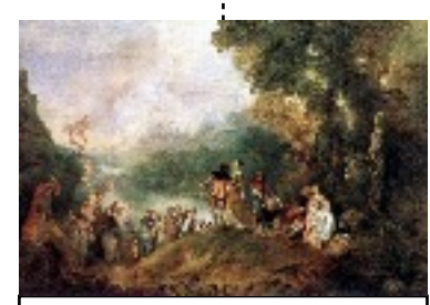
Antoine Watteau peint L'Embarquement pour l'île de Cythère. 1717