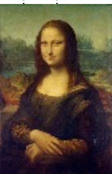
Léonard de Vinci peint la Joconde. 1504