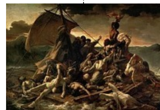
Théodore Géricault peint le radeau de la Méduse. (romantisme) 1819