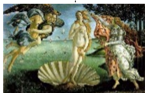
Botticelli peint la naissance de Vénus. 1485