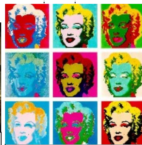
Andy Warhol , Marylin Monroe. (absurde) 1967