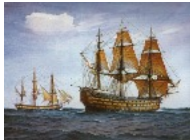
navire de ligne