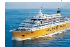
bateau de croisière