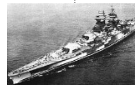
cuirassé utilisé lors de la première guerre mondial 1914