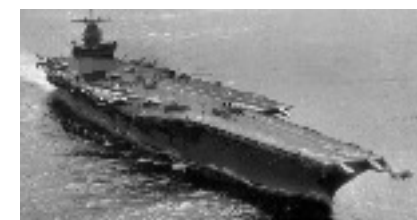
porte avion utilisé lors de la seconde guerre mondial 1939