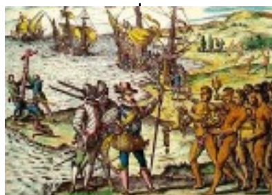
découverte de l'Amérique 1492