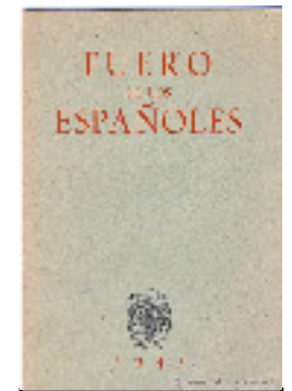
Promulgation du "Fuero de los Españoles" ("Charte des Espagnols") 17/07/1945

Promulgation de la "Loi du référendum national" 22/10/1945