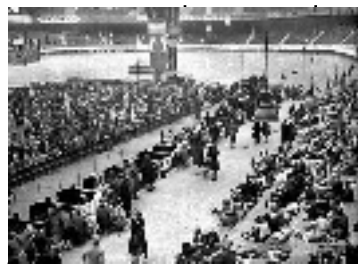
Rafle des juifs au Vélodrome d'Hiver 16/07/1942

Lois sur le statut des Juifs dans la France de Vichy 03/10/1940