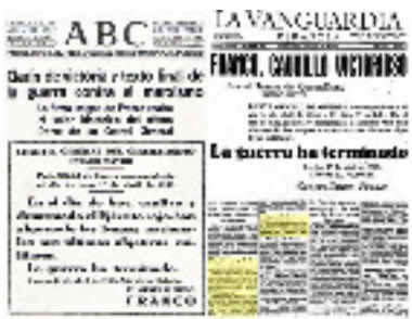
Fin de la guerre civile. Début de la dictature de Franco (1 avril 1939)