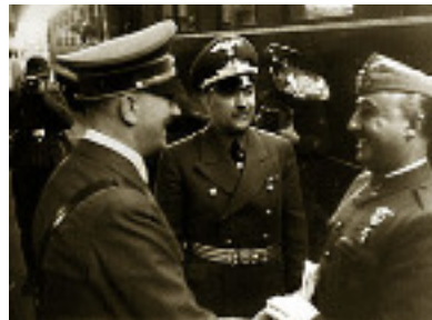
Entrevue d'Hendaye entre Franco et Hitler 23/10/1940

● 15/10/1940 Lluís Companys est exécuté à Montjuïc