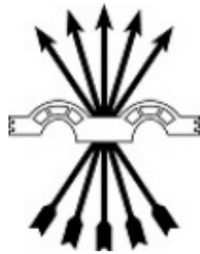
Création du Syndicat Vertical