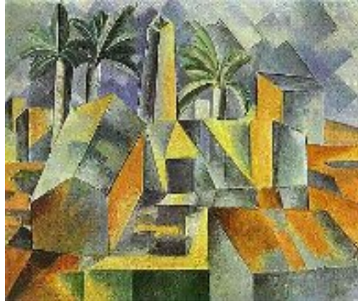
Apparition du cubisme cézannien (Ex: Usine à Horta de Ebro, Picasso, 1907) 1907 à 1910