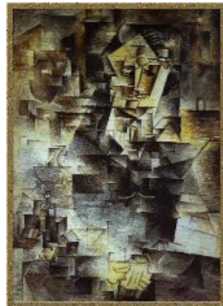
Apparition du cubisme analytique (Ex: Portrait de Kahnweiler, Picasso, 1910) 1910 à 1912