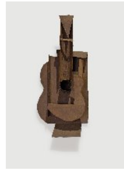
Apparition du cubisme synthétique (Ex: Guitare Papier, Picasso, 1912) 1912 à 1914