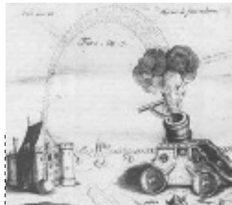
Bataille de Crécy 1346