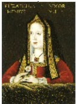
Couronnement de la reine Elizabeth à Londres 1487