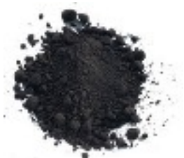
Découverte de la poudre noire 500