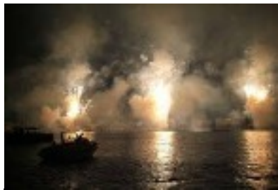
Amélioration de la technique pyrotechnique 600