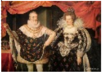
Mariage de Louis XIII 1615