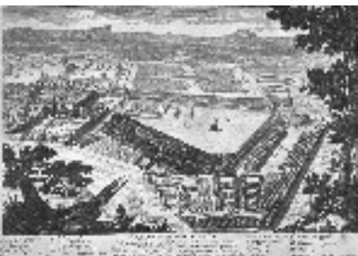
1er feux d'artifice avec de la poudre noire (Fontainebleau) 1606