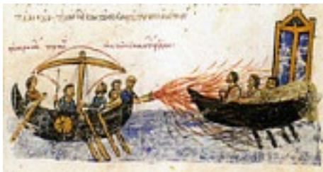
Feux Grégeois par les Arabes 1250