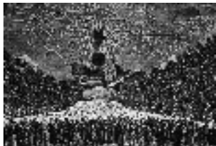
Feux d'artifice, place de l'Etoile à Paris (14 juillet) 1801