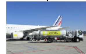
Premiers essais des biocarburants 2008