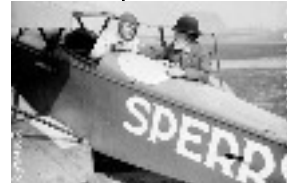
Les Aérodynes: Création du pilote automatique 1912