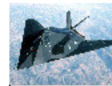
Les Aérodynes: La Technologie Furtive 1981