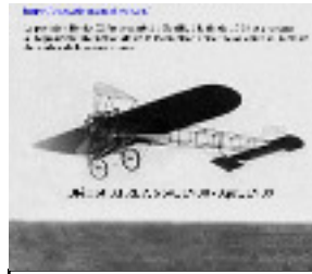
Les Aérodynes: Le Blériot XI 1909