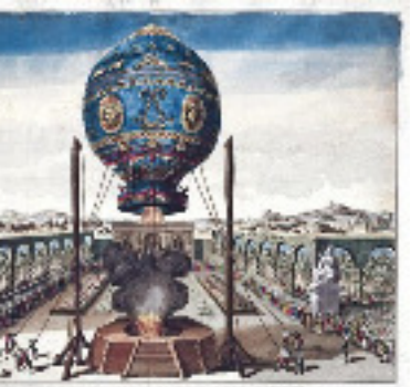
stats: La Montgolfière 1783