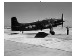
Le Douglas A-1 Skyraider ou AD Skyraider est un bombardier d'appui tactique mono-moteur à pistons, l'un des derniers utilisés par des armées de l'air moderne 1946