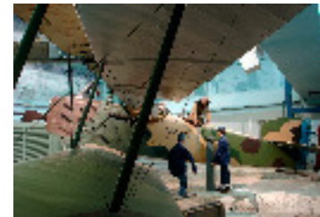
Le Breguet XIV est l'un des appareils majeurs de la 1ere guerre mondiale. Robuste, il est utilisé pour le bombardement comme la reconnaissance. Le moteur Renault de 300 cv lui permet d'évoluer vite et à haute altitude 1917