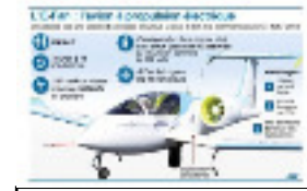
Vol de l'E-fan 2014