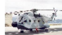
Le Super Frelon 1960