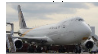
Le Boeing 747 Le 747 a été conçu pour répondre à l'accroissement du transport aérien dans les années 1960, à la suite du succès des Boeing 707 et Douglas DC-8 qui étaient les précurseurs des voyages à grande distance par avions à réaction. 1970