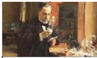
Louis Pasteur : le vaccin contre la rage 1885