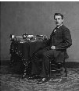
Thomas Edison (USA) : le phonographe 1877