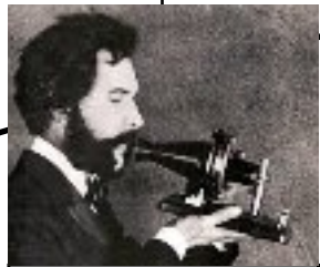
Graham Bell (Angleterre) : le téléphone 1876