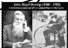
John Boyd Dunlop (Ecosse) : les pneumatiques 1887