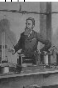
Wilhem Conrad Röntgen (Allemagne) : les rayons X 1901