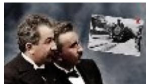
Louis et Auguste Lumière (France) : le cinématographe, 1895