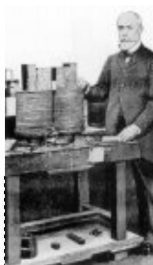
Henri Becquerel (France) : la radioactivité 1896