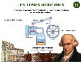
James Watt (Angleterre) : la Machine à vapeur 1776