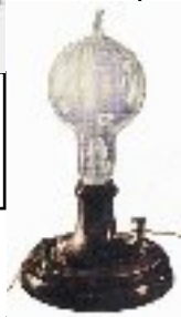
Thomas Edison (USA) : l'ampoule électrique 1879