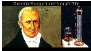
Alessandro Volta (Italie) : la pile électrique 1800