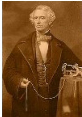
Samuel Morse (USA) : le télégraphe 1841