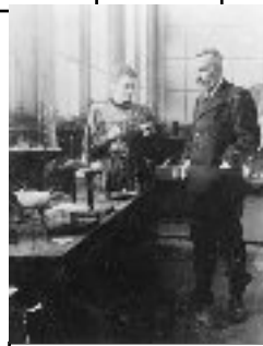
Pierre et Marie Curie (France) : le radium 1898