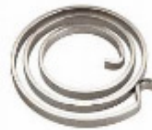
le ressort à spirale 1825