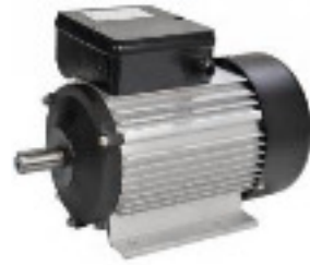
moteur électrique automate/énergie électrique 1820