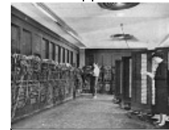
le premier ordinateur robot/mécanique 1956