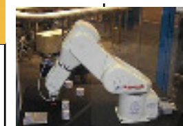
le robot unimate 1954