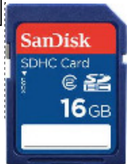
carte memoire robot/électrique 1975