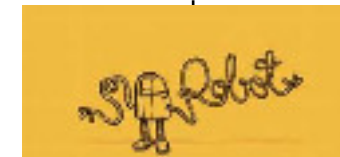
signification du mot robot en 1900 : « travail, besoin, corvée » 1920