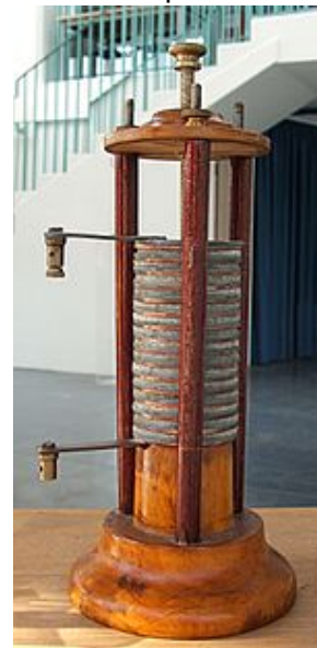
pile hydro-électrique automate/énergie électrique 1800