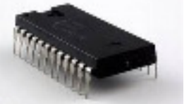
microprocesseur robot/électrique 1971