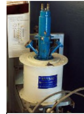
tube amplificateur elctrique/robot 1908