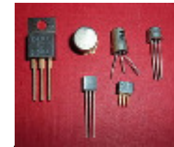
transistor robot/électrique 1947