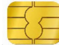
circuit intégré électrique/robot 1958