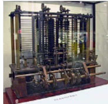
calculateur robot/énergie électrique 1850