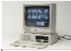
le premier ordinateur d'IBM robot/électrique 1981