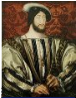
François Ier, un grand roi de France (1494, 1547) 1515