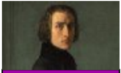
Franz Liszt, compositeur au grand cœur (1811, 1886) 1820