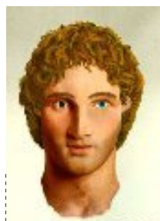
Alexandre le Grand (-356, -323) -338

-450 -400 -350 -300 -250 -200 -150 -100 -50 1 50 100 150 200 250 300 350