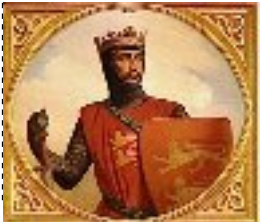
Guillaume le Conquérant (1027, 1087) 1033