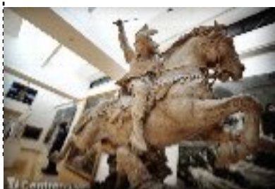
Camille Furianus et les Gaulois (fin -Ve siècle, -363) -403