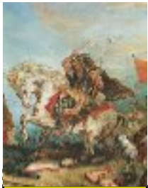
Attila "le fléau de Dieu" (395, 453) 434