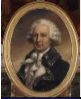
Louis-Antoine de Bougainville (1729, 1811) 1768