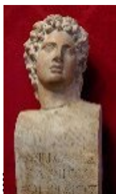
Alcibiade, un homme ambitieux et sans scrupule (-450, -404) -421