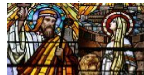
Ste Blandine et St Pothin 177