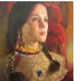
Anne Comnène (1083, 1153) 1091

400 450 500 550 600 650 700 750 800 850 900 950 1000 1050 1100 1150 1200