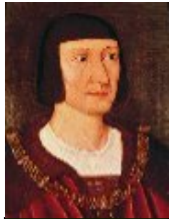
Bayard, le chevalier sans peur et sans reproche (1475, 1524) 1486