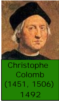
Christophe Colomb (1451, 1506) 1492