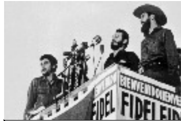
Prise de pouvoir par Fidel Castro. 1959