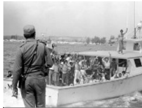
Départ de 125 000 Cubains vers les États-Unis du port de Mariel. 1980