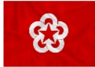
Cuba adhère au Comecon. 1972