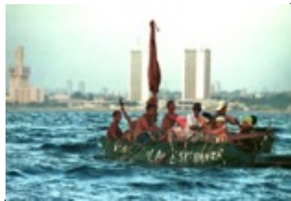
Crise des balseros: 30 000 Cubains quittent le pays sur des radeaux de fortune. 1994