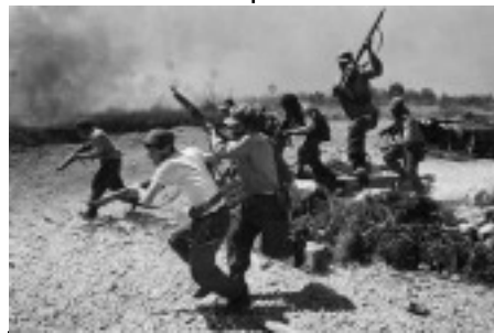
Échec du débarquement de contre-révolutionnaires cubains dans la baie des Cochons. 1961