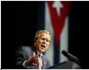
Le gouvernement Bush renforce les restrictions pour les citoyens américains se rendant à Cuba. 2003