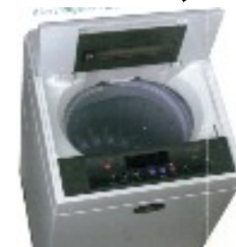
Machine à laver Daewoo à pulstateur et tambour vertical, apparue en 1995