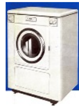
Machine à laver automatique Bendix apparue en 1953