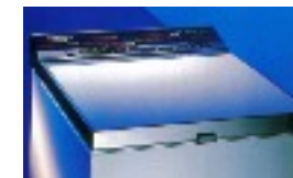
Toute 1ère machine à laver Thomson à touches sensitive et automatique, ce modèle est apparue en 1985