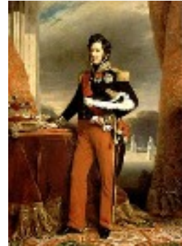
Louis Philippe 1830 à 1848