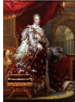
Charles X 1824 à 1830