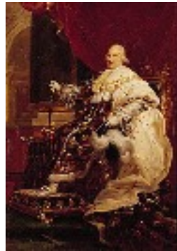
Louis XVIII 1814 à 1824