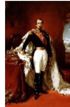
Bonaparte (1848-1851) qui devient Napoléon III (1851-1870) 1848 à 1870