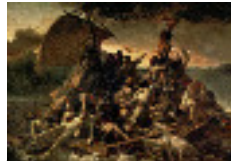
Géricault : le radeau de la méduse 1818