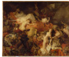
Delacroix: la mort de Sardanapale 1827