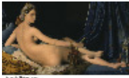
Ingres : la grande odalisque 1814