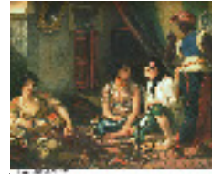
Delacroix :les femmes d'Alger. 1834