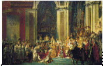
David: le sacre de Napoléon 1805