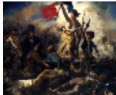
Delacroix: la liberté guidant le peuple 1830