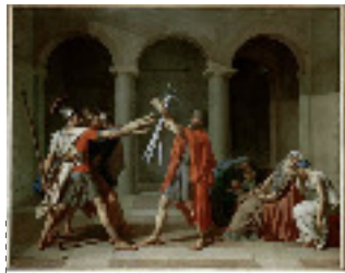
David: Le serment des horaces 1784